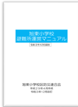
避難所運営マニュアル