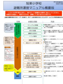
マニュアルの概要版