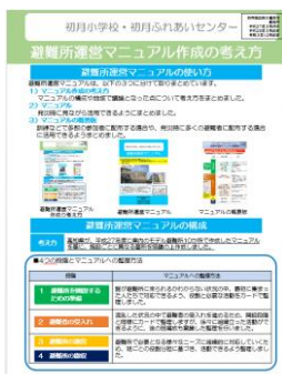
避難所運営マニュアル 作成の考え方

訓練などで多数の参加者に配布する場合や、発災時に多くの避難者に配布する場合に活用できるようまとめました。