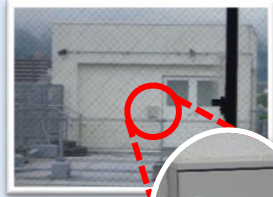
北舎屋上 キーボックス

校舎内に入るために 北舎屋上のキーボックス 内に屋上から校舎内に入るための カギ が保管されています。 (震度5弱で自動解錠)