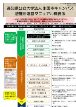
マニュアルの概要版