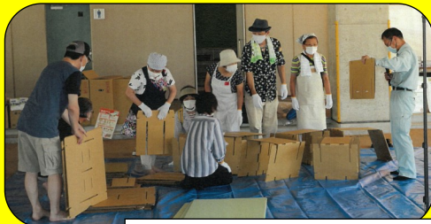
ダンボールベッド作成の様子

潮江東地区では潮江東地区連合防災会が、震災の際に潮江東小学校での共同生活を円滑に送り、復興に向けてスムーズに移行できるように、事前に訓練を行っており、潮江東小学校区地域内連携協議会もイベントの運営面で協力し、防災意識向上や地域とのつながりの強化を図っています！