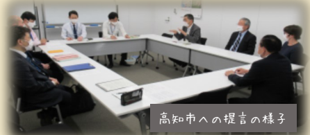
高知市への提言の様子