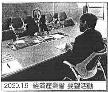
2020.1.9 経済産業省 要望活動