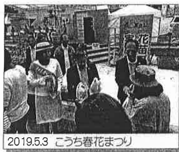
2019.5.3 こうち春花まつり