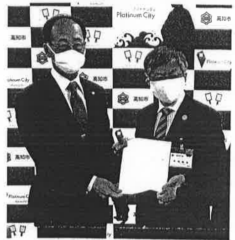
岡崎市長に緊急要望書を提出

新型コロナウイルスの感染拡大を防ぐため、全国に発令された緊急事態宣言が5月末まで延長されることとなりました。先行きが見通せないなか、高知市の観光業、宿泊業、運輸、飲食業など経済社会への影響は甚大なものとなっており、多くの事業者が事業存続の危機感を抱いております。このように、市長は、市民の暮らしの不安をするため、事業者の皆さんへの独自の支援を展開する必要があります。国・県と連携を図りながら回復への道筋を考え、迅速で正確な対応を市長に求めてまいります。