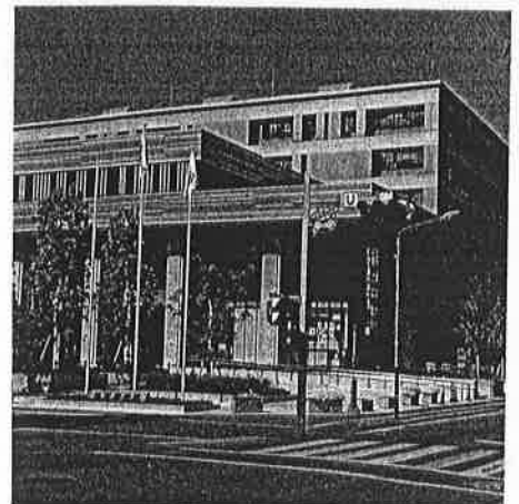
市役所新庁舎落成 2019/12/28 高知市市制120周年

借り換えは将来世代への負担となり課題を残したままとなります。今後の市長の財政再建への舵取りに、しっかりと意見を述べていきます。