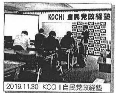
2019.11.30 KOCHI 自民政経塾