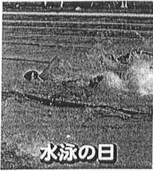
2021 年 高知大会開催予定