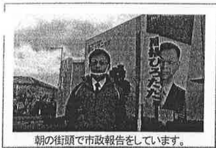
朝の街頭で市政報告をしています。