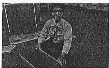
段ボールベッドの組立訓練にて。