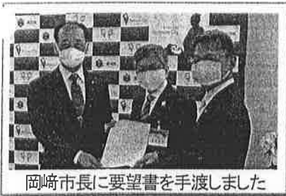
岡崎市長に要望書を手渡しました

(特集号・新型コロナ対策) 山嶽会通信 (さんがくかいつうしん) 令和2年5月1日号