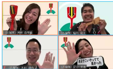
(8/9参加のよさこい移住応援隊メンバー)

また、後半では、3つに分けられた部屋でそれぞれ座談会を行い、思い思いのよさこいトークが繰り広げられ、よさこいのない夏でもよさこいを感じていただける夜をお過ごしいただけたのではないのでしょうか。