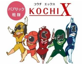
《 広聴広報マスコットキャラクター 》