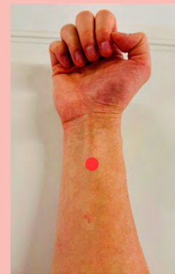
手のひらの付け根から、指3本分くらいの隙間を開けたところが「内関穴」のツボ!

次号も皆さんのお悩みに寄り添う連載に育てていきます。どうぞよろしくお願いたします。