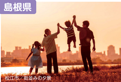
松江市／街並みの夕景

人とのつながり、穏やかな時間が“自分らしい明日”を後押ししてくれます。働きやすく、暮らしやすい「島根」を選んでみませんか。