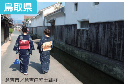
倉吉市／倉吉白壁土蔵群

ゆったり、うっとり、ほっこり、鳥取。暮らしの楽しみ方は十人十色。あなただけの移住物語、一緒に作ってみませんか？