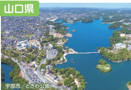
宇部市／ときわ公園

日本海、瀬戸内海に面し、豊かな自然に恵まれ、都市部にもアクセスしやすい山口県。「意外にいいかも」と思える魅力が詰まっています!