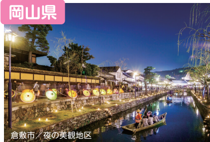
倉敷市／夜の美観地区

海や里山、城下町ぐらしなど様々な暮らしが選べる岡山県。地震等の自然災害が少なく、交通網も充実した「晴れの国」であなたにぴったりの暮らしを見つけてみませんか。