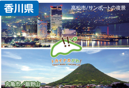
高松市／サンポートの夜景