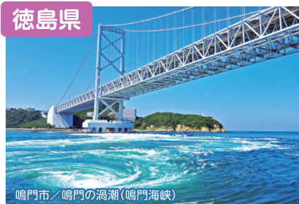
鳴門市／鳴門の渦潮(鳴門海峡)

豊かな自然を満喫しながら、良好なテレワーク環境が整っているとくしまで、自分らしいライフスタイルを見つけてみませんか？