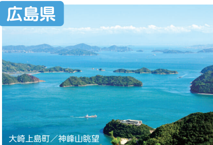
大崎上島町／神峰山眺望

広島県には、海・山・川の豊かな自然やそれに隣接する高い都市機能があります。広島県は、チャレンジする人や、夢を見る人を全力で応援します!!