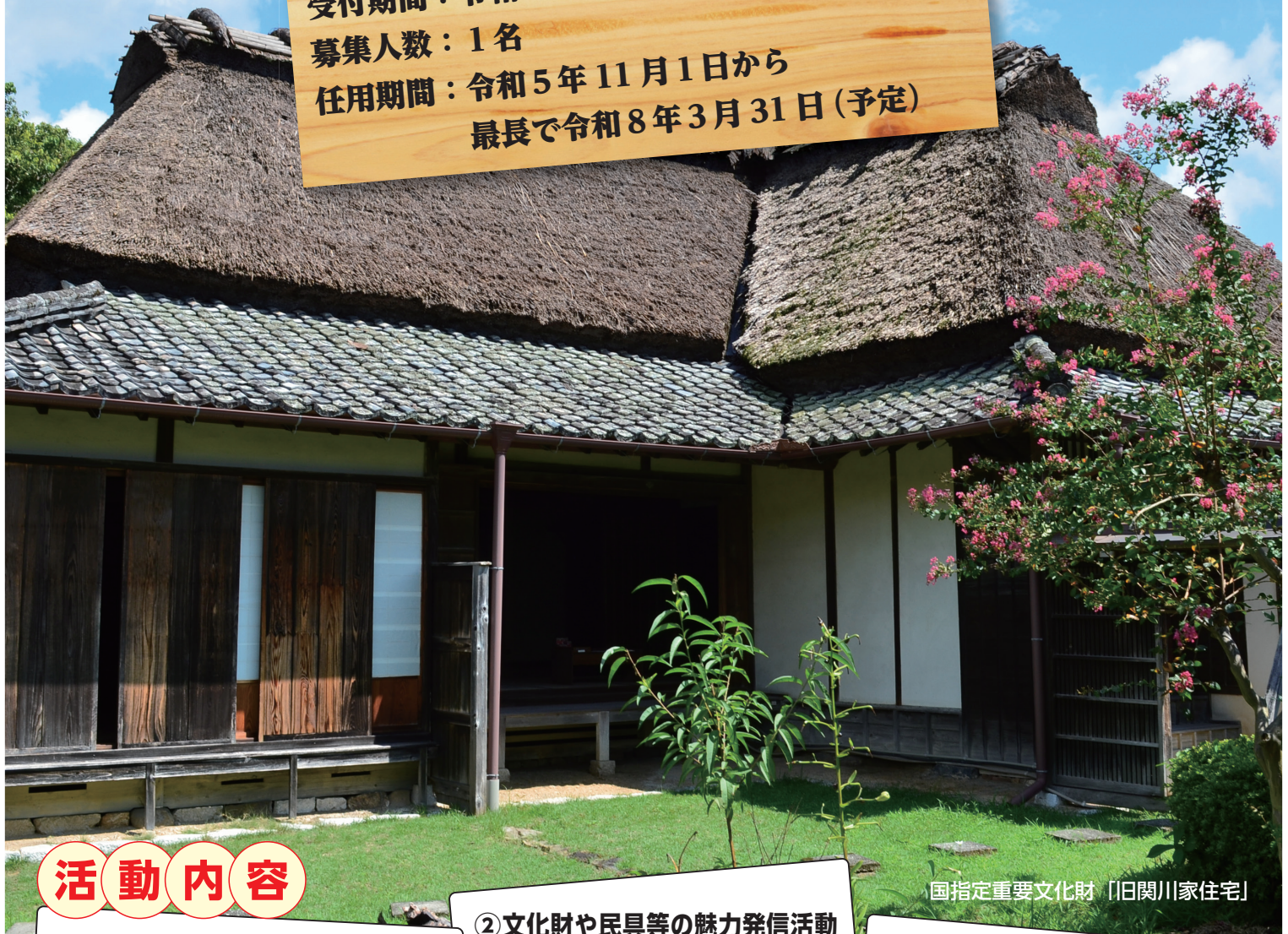
国指定重要文化財「旧関川家住宅」

受付期間：令和5年8月31日(木) 17時必着 募集人数：1名 任用期間：令和5年11月1日から 最長で令和8年3月31日(予定)