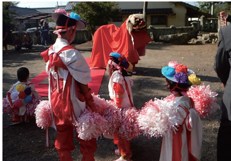
▲諸木八幡宮神社秋の大祭