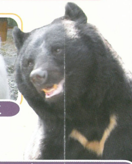
ニッポンツキノワグマ