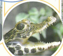
アフリカコガタワニ