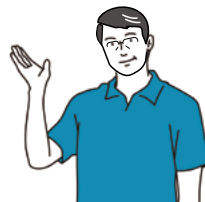
高知市長 桑名 龍吾