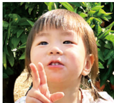
いちか ・ 一楓 ちゃん (2歳) お人形遊びが大好き♡ みんなのお世話は私に 任せてね♪