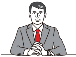
高知市長 桑名 龍吾