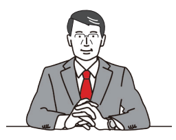
高知市長 桑名 龍吾