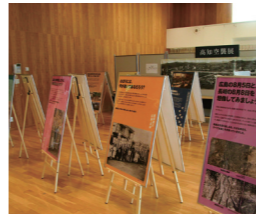
昨年開催した「核兵器と戦争に関する16の問い展」と題したパネル展の様子

営され、行政のみならず市民団体の皆さんとともに、平和への思いをつなぐ活動を続けています。 現在、世界はさまざまな課題が複雑に絡み合い、多くの地域で紛争や対立が続いています。SDGsの中でも、「平和と公正をすべての人に」のゴールは、私たちの人権や日常生活に深く関わる重要なテーマです。地域でお互いに支え合い、誰もが安心して暮らせる社会をつくるのが平和の基盤を強くする一歩につながります。 戦後80年の節目にあたり、過去を語り、今を見つめながら、一人一人が未来へ続く平和のバトンを次の世代へつなぐために行動していきます。 【問い合わせ】総務課国際平和担当 ☎82339955