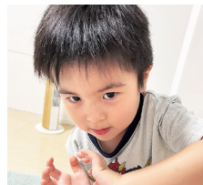
さくや ・ 朔弥 ちゃん (3歳) エンゲージ! ゴジウ ジャーが僕のヒーロー♪ クラップユアハンズ!