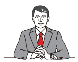
高知市長 桑名 龍吾