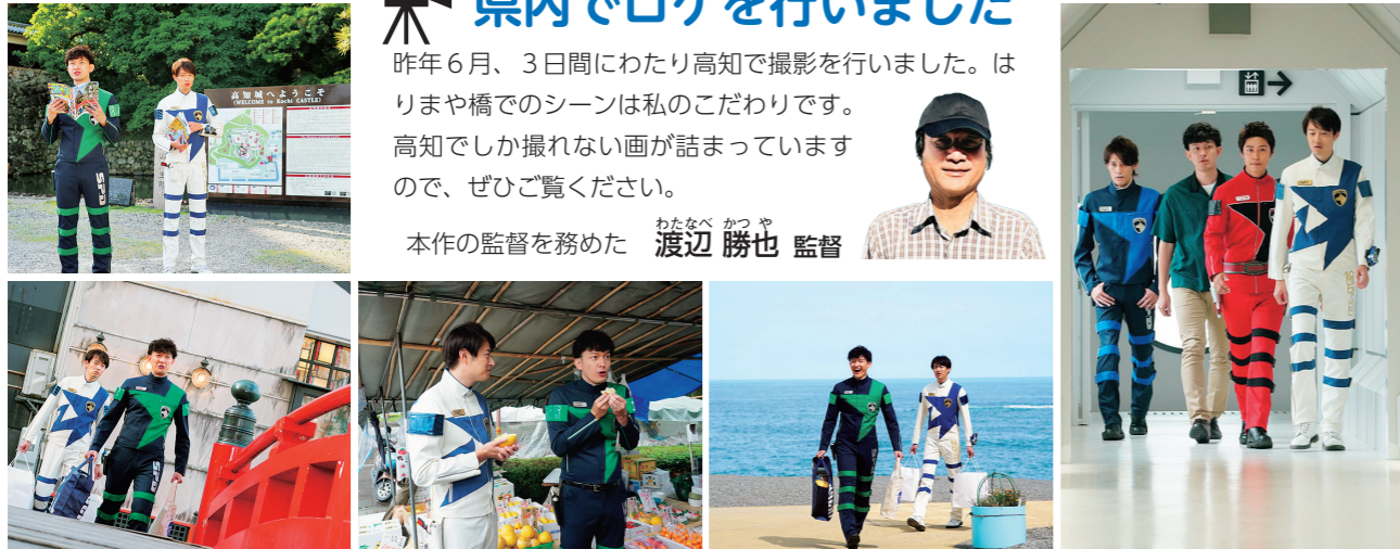
ロケ地：高知城、桂浜、はりまや橋、県立牧野植物園、日曜市、高知市役所、海洋堂スペースファクトリーなんこく（南国市）