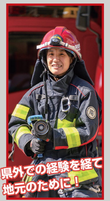
県外での経験を経て地元のために！