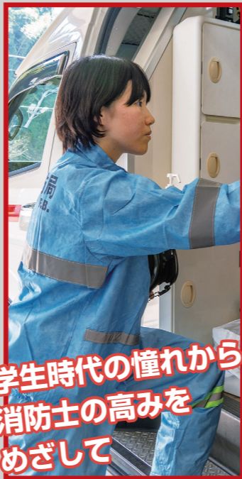
学生時代の憧れから消防士の高みをめざして