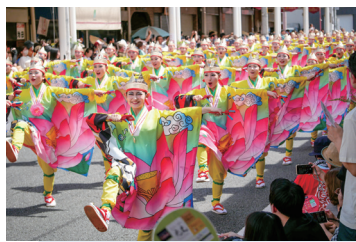
8月11日(金・祝) 第70回 よさこい祭り