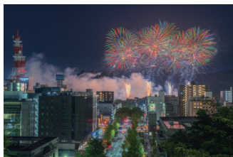
8月13日(日) 高知市納涼花火大会

(株)片岡電気工事、北村商事(株)、(株)高知電子計算センター、新進建設(株)、社会医療法人仁生会、南海化学(株)土佐工場の6事業者を表彰しました。