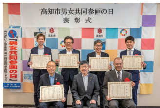
8月1日(火) 高知市男女共同参画推進企業表彰式

(株)片岡電気工事、北村商事(株)、(株)高知電子計算センター、新進建設(株)、社会医療法人仁生会、南海化学(株)土佐工場の6事業者を表彰しました。