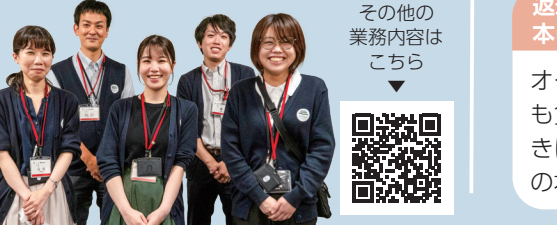
▲図書館・科学館課の皆さん

知っていますか? オーテピアアプリ オーテピアアプリには、本をもっと便利にもっと楽しくするさまざまな機能があります。図書館を利用の際には、ぜひご活用ください。