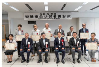
8月18日(金) 交通安全功労者表彰式

当初の8月9日から延期となりましたが、当日は天候に恵まれ、たくさんの人々が夜空を美しく彩る花火を楽しんでいました。