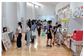
8月19日(土) とさつ子タウンが4年ぶりに開催

地域の交通安全のために取り組んでいる個人9人と、事業所内での安全管理などに取り組む2団体(大津保育園、くろしお通信サービス(株))が表彰されました。