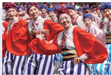
8月9日～12日の4日間、踊り子たちの白熱した舞いが披露されました。[大賞] とらっくよさこい(ちふれ) [金賞] 十人十彩、ほにや、旭食品