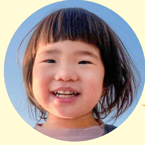
めい 芽生 ちゃん (2歳)

果物が大好きで、ついつい食べ過ぎちゃうんだ! アンパンマンのガチャガチャがマイブームだよ!