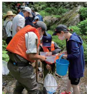
「鏡川わくわくツアー」で生き物を探す子どもたち