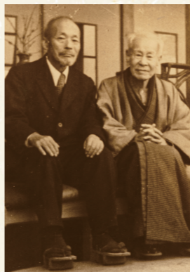
田中茂穂(左)と牧野富太郎

牧野は、全国で植物を採集し、新種を発見し、一九四〇年には『牧野日本植物図鑑』を出版した。この図鑑を編集するのに、約十年の歳月がかかったという。