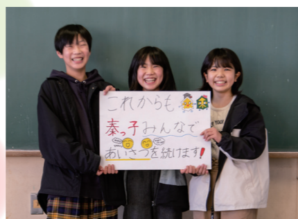
「秦小学校児童会」の皆さん