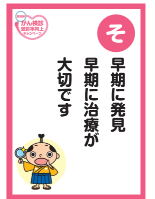
「高知県がん検診啓発用かるた」より