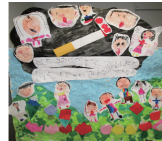
▲とさやま保育園園児作成の啓発ポスター

禁煙すると2週間～3か月後には心臓や肺の機能が改善し、 5年後には脳卒中になる危険性が、たばこを吸わない人と 同じレベルになります。 また、料理の味がより分かるようになり、おいしさが増します。 ほかに、咳や痰が減りスッキリするなど禁煙で得られる効果は たくさんあります。