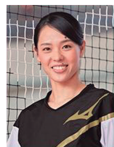
当日は私と一緒に楽しもう！

申し込みはいつでも2月17日(月)14時から、申込用紙に記入し、直接・FAX・またはホームページから申し込みください。定員になり次第受付終了。