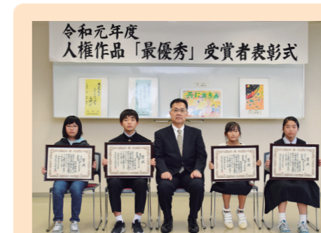
▲最優秀賞を受賞した皆さん

表彰式では、最優秀賞を受賞した4人の皆さんが、作品を通して、自分の思いや願いを発表してくれました。皆さんの優しさや温かい心が伝わってくる、素晴らしい表彰式になりました。