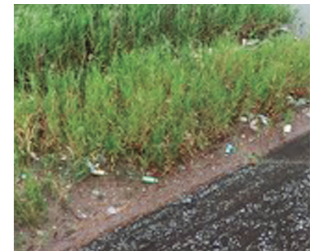
▲山中の不法投棄されたごみ