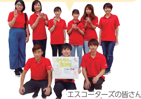
エスコーターズの皆さん

商店街や商工会議所のサポートを受けながら活動を続け、来年でなんと20周年を迎えます！