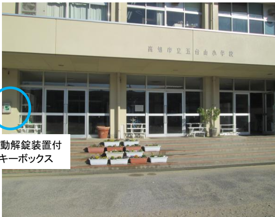
自動解錠装置付 キーボックス