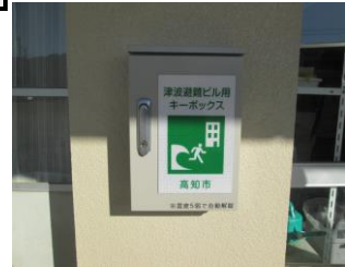
自動解錠装置付キーボックス