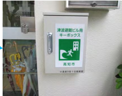
自動解錠装置付キーボックス