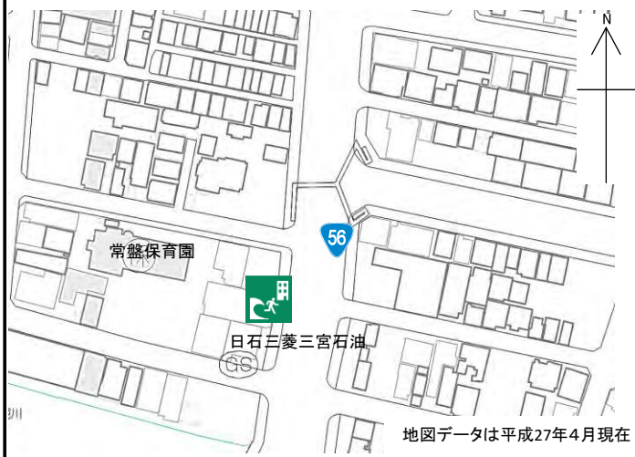
地図データは平成27年4月現在