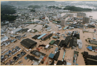
平成10年の集中豪雨で浸水した高知市東部の様子