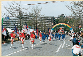
市制100周年記念パレード