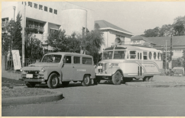
昭和28年ごろの市民図書館