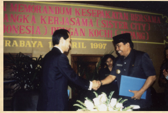
インドネシア共和国スラバヤ市での姉妹都市調印式