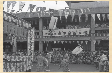
前年に落成した本庁舎前でのよさこい祭り（昭和34年）