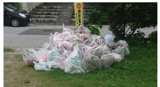
▲平成30年度の七河川一斉清掃の様子