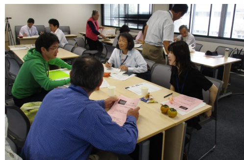
▲第1期 (平成29~30年度) 講座の様子

ゼミナールでは、組織力の向上や活動の活性化、仲間や参加者・活動資金の増やし方、受講生の所属団体に関する具体的な悩みなどの解決に向けた学習講座を実施予定です。ご関心のある方は地域コミュニティ推進課までご連絡ください。