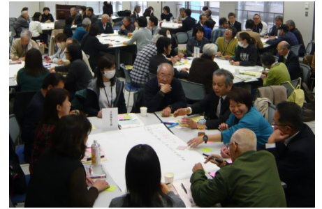
▲副市長もワークショップに参加しました。