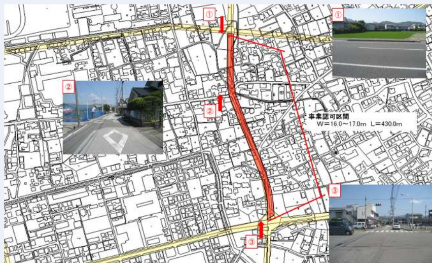
曙町西横町線（中工区）

朝倉地区の南北軸を形成する幹線道路となる「曙町西横町線」の整備に向けて、建物等物件調査、移転補償及び用地買収を行います。