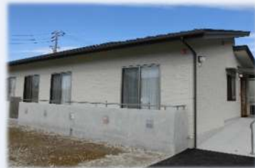
【健康福祉部障がい福祉課】