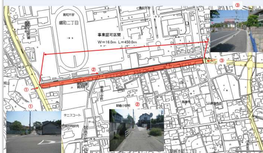
鴨部北城山線（第2工区）

朝倉地区の東西軸を形成する幹線道路となる「鴨部北城山線」の整備に向けて、建物等物件調査、移転補償及び用地買収を行います。