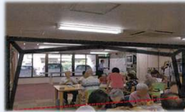
【健康福祉部介護保険課】

認知症高齢者グループホーム等における利用者等の安全性確保のため、社会医療法人等が行う耐震改修等の経費を補助します。