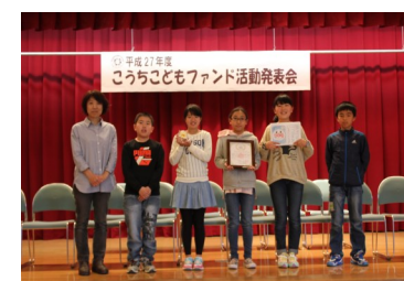
『ベストピカッと賞』