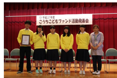
『ベストパフォーマンス賞』