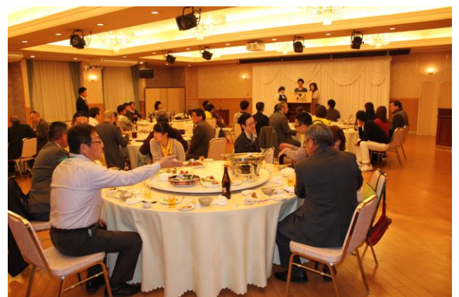
第2部の懇親会では、お酒を酌み交わしながら楽しく交流しました♪