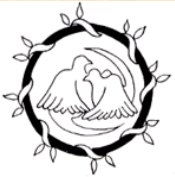
高知市生徒会交流会 シンボルマーク

学校生活が充実するためには、各中学校の生徒会役員がリーダーとしての自覚をもち、教員の助言や支援を受けながら、生徒自身の力で諸活動を企画したり運営したりする力を育てる必要がある。そのためにこの研修会は、高知市中学校生徒会交流会運営委員会が中心となって、昭和63年から行われている。