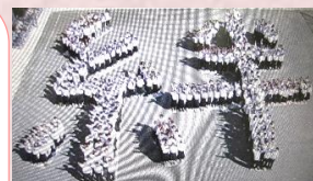
【潮江中学校の全校生徒で作成した人文字】