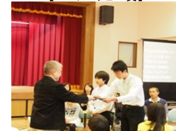
高知市立愛宕中学校生徒会