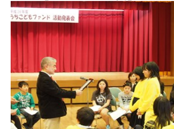
Food Treasure Hunter In Namegawa