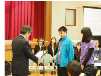
キッズパフォーマーズ土佐チル