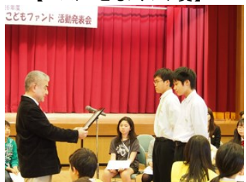
高知市立介良中学校生徒会