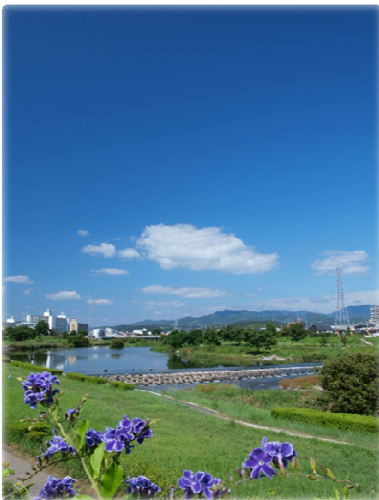
【 川づくり 】