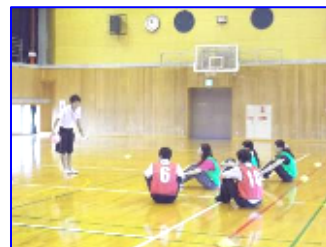
児童役に向けて熱心に説明