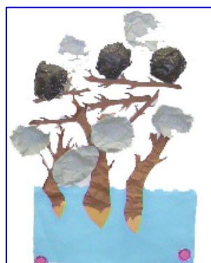
材料を動かしダム作り

本時の目標は、「ビーバーがダムを作る順序を読み取る」こと。目標を達成するため, また確認するために, 次のような工夫(手立て)があった。