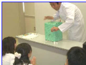
電磁石の実験も白衣もばっちり