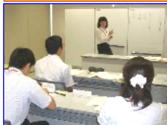
児童役も真剣そのもの