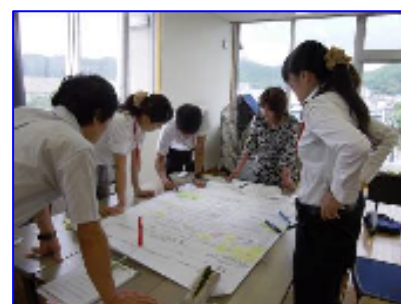
充実したワークショップ