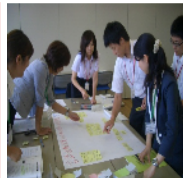
グループで成果物を作成する受講者