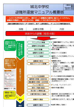
マニュアルの概要版