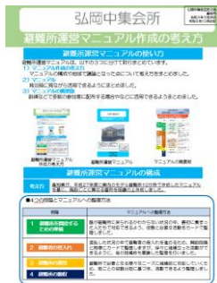
避難所運営マニュアル 作成の考え方