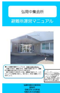
避難所運営マニュアル