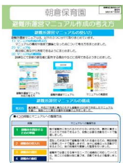
避難所運営マニュアル 作成の考え方