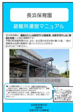
避難所運営マニュアル