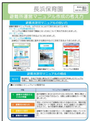
避難所運営マニュアル 作成の考え方